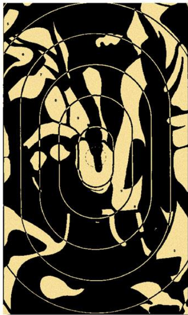
BDMP Scheibe PP1

Die Ergebnisse des Schießens werden je Wertungsklasse in der Bestenermittlung gem. DSB, bei Ringgleichheit mit den besten geschossenen 5'er-Serien gewertet. Bei der Sniperwertung ist die Anzahl geschossener 10'er, 9'er usw. bei X-er Gleichheit im Ergebnis entscheidend.